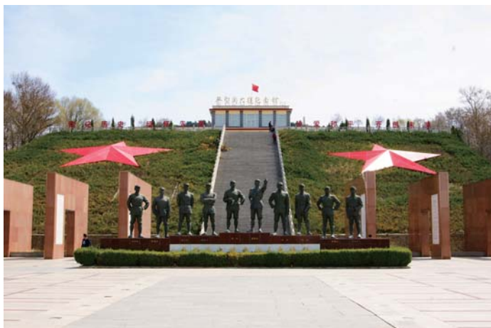
□平型关 作者 郭庆

开展“畅谈十八大以来变化，展望十九大胜利召开”活动是深入学习贯彻落实习近平总书记关于老干部工作的重要指示精神的具体体现。依据院2017年离退休干部工作要点指出要采用多种形式，把中央领导同志的有关重要指示和讲话精神传达到每一位老同志的要求，一二九街退休党支部和管委会分别向党员和群众传达了院离退休干部工作局举办的“学习贯彻全国‘双先’表彰大会精神全面做好离退休干部工作”视频会精神。通过视频会传达了习近平总书记关于老干部工作的重要指示和刘云山等中央领导同志的重要讲话精神，以重要指示和重要讲话精神为指导开展好“畅谈十八大以来变化，展望十九大胜利召开”活动。（文/林治银）