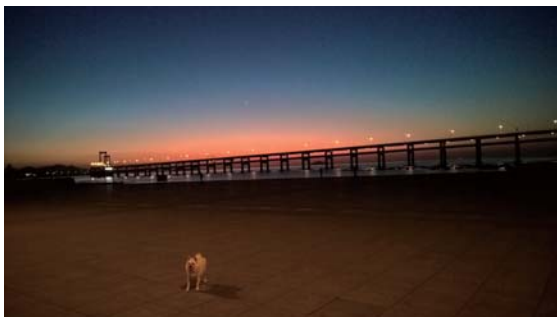
□夜幕下的跨海大桥 石仁敏