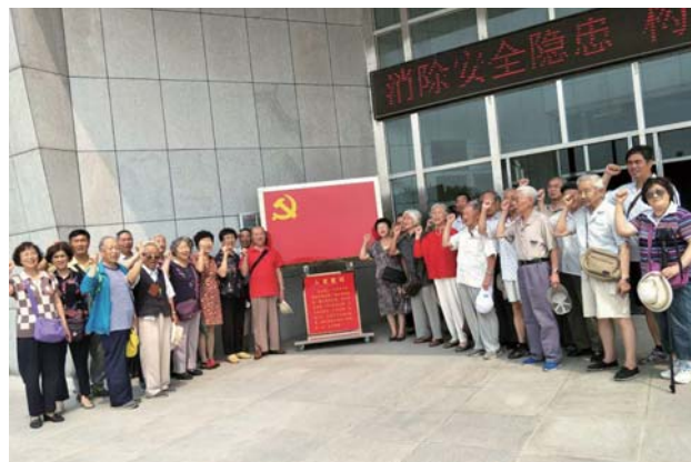
一二九街党支部党员 庄严地在关向应纪念馆门前党旗下宣誓

二站退休一支部长期坚持把关心病困党员放在重要的工作位置上，对病困党员的情况了如指掌，坚持利用“七一”和重要节日走访慰问，对住院的党员坚持去探视，这项工作已成为支部工作的制度。（文 / 二站退休一支部）