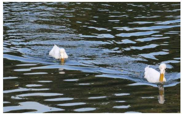
形影不离 □ 邵明君

吴俊圻、沈惠华两位老师90大寿，所离退休办公室代表所里各送去生日慰问金1000元。祝愿两位老师福如东海长流水，寿比南山不老松！