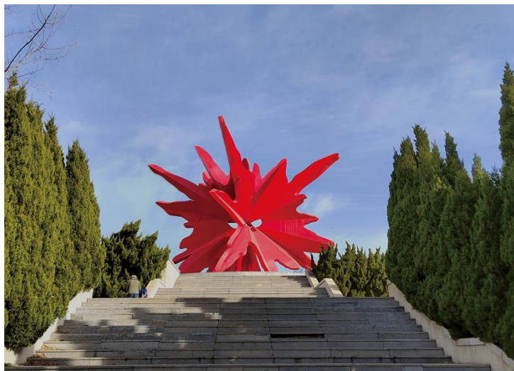
大连英雄纪念公园 □高秀英