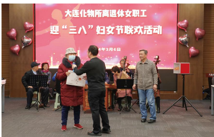
现场抽奖一等奖获得者