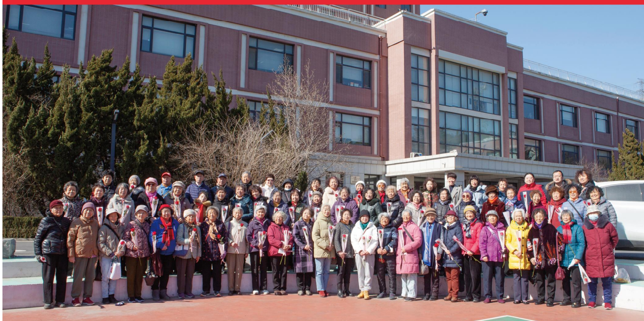
大连化物所离退休女职工迎“三八”妇女节联欢活动合影留念 2024年3月6日