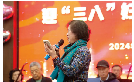
李群老师独唱表演