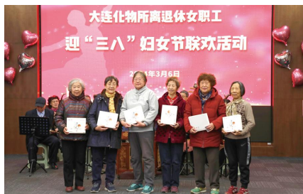
现场抽奖二等奖获得者