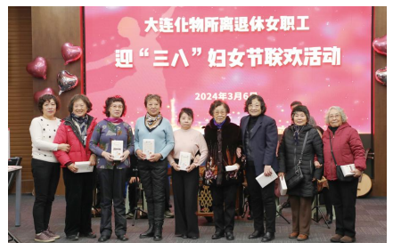
现场抽奖三等奖获得者