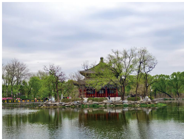
圆明园春色 □徐大力