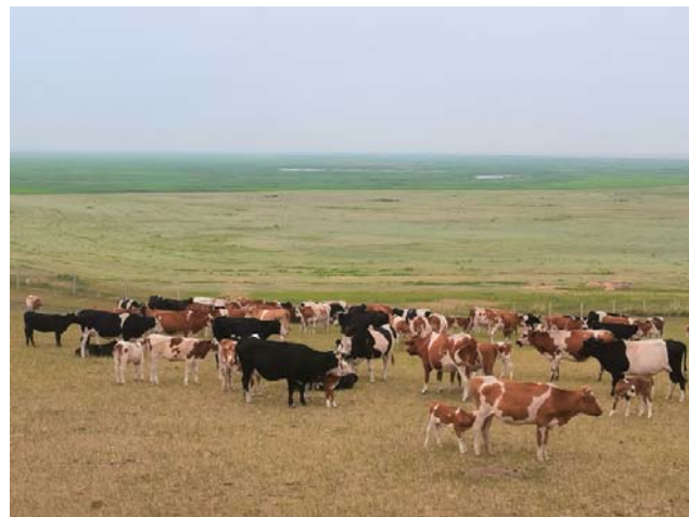
风吹草低见牛羊 □时洪伦