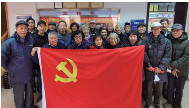
二站退休职工第三党支部组织学习 党的十九届六中全会精神