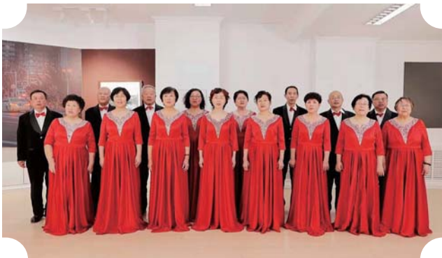
合唱团演唱《共产党好，共产党亲》