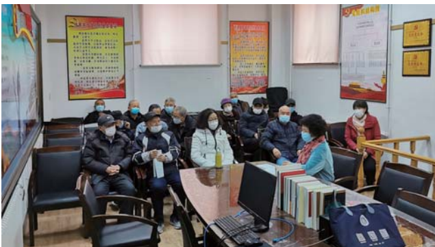
二站退休职工第一党支部组织学习 党的十九届六中全会精神