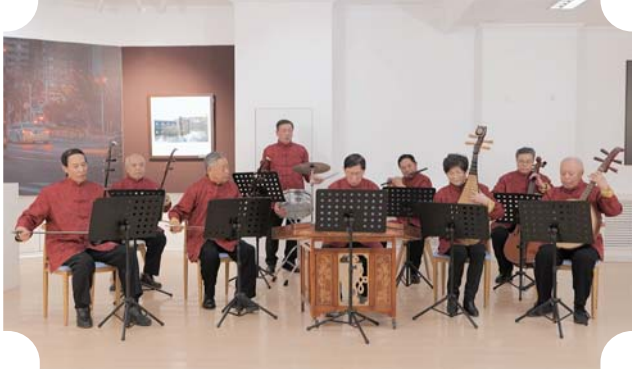
小乐队演奏《我和我的祖国》