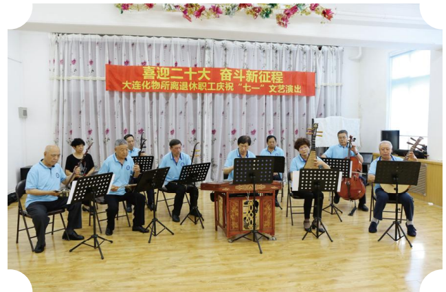
器乐合奏《万疆》 表演者：大连化物所夕阳红小乐队【下转4版】