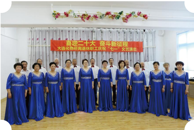
合唱《伟大的国家伟大的党》《一切献给党》 演唱：大连化物所老年大学合唱团