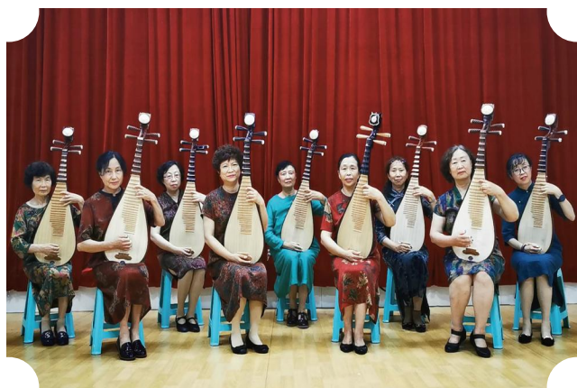
琵琶齐奏《欢乐的日子》 表演者：大连化物所老年大学琵琶班