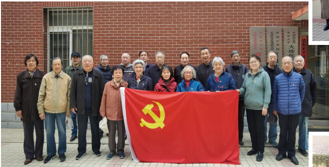
二站退休职工第三党支部换届会议