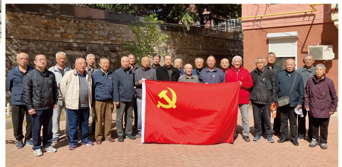
南山退休职工党支部换届会议