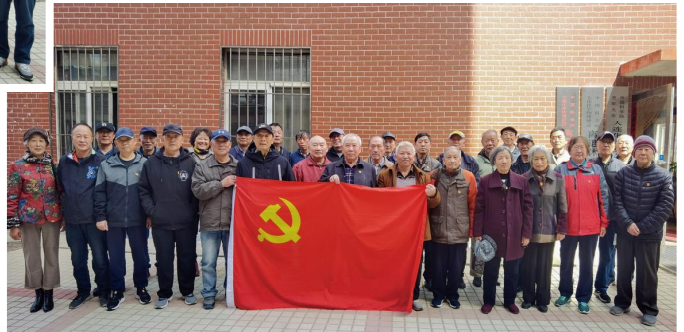
二站退休职工第二党支部换届会议