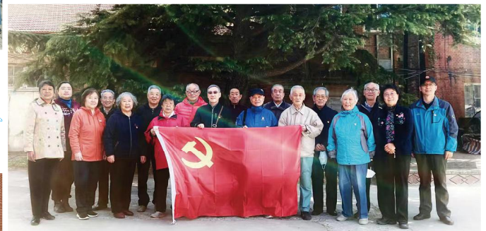
一二九街退休职工第一党支部换届会议