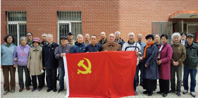
二站退休职工第一党支部换届会议