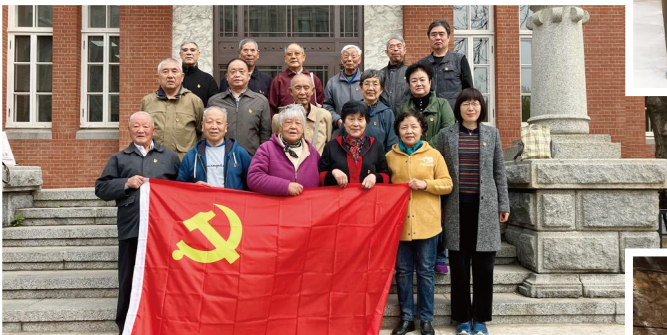
一二九街退休职工第二党支部换届会议