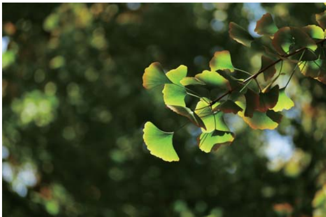
树林中的绿蝴蝶 □徐晓敏