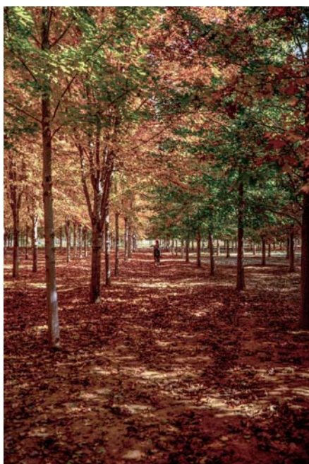
橙黄桔绿的秋天 □邢会坤